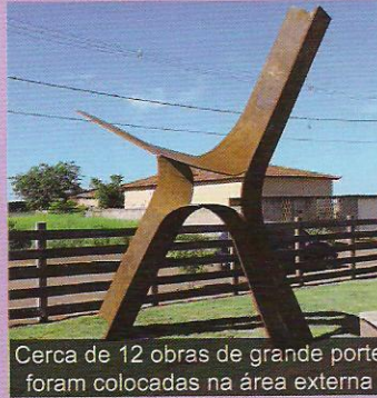
Cerca de 12 obras de grande porte foram colocadas na área externa