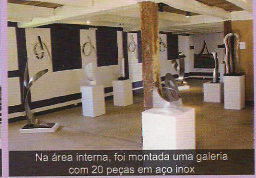
Na área interna, foi montada uma galeria com 20 peças em aço inox